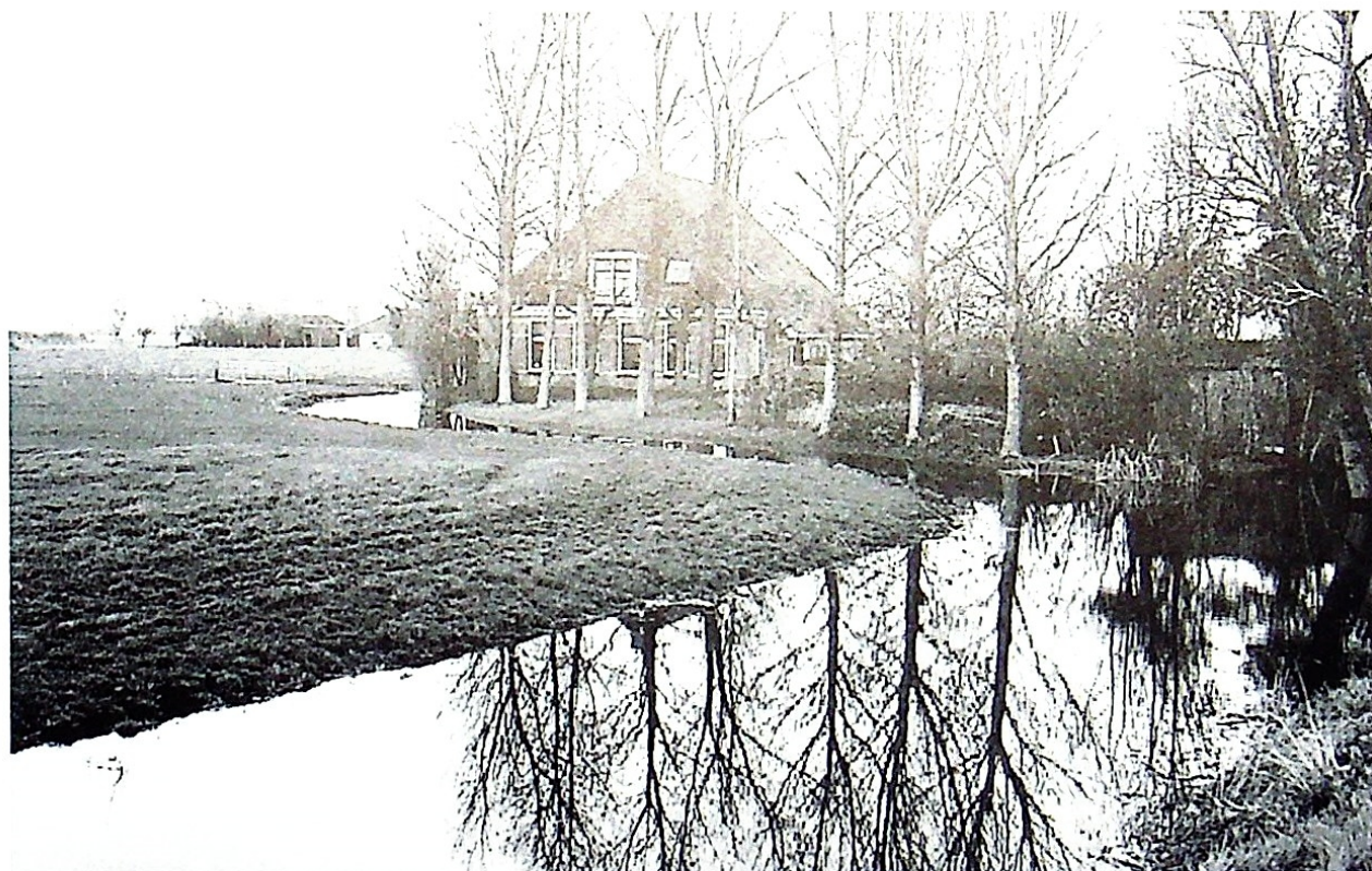
Spultsje Sânleansterdyk 15. In âlde earm fan de Frjentsjerterfeart by Reahûs. Hjir gong ieuwenlang it skipferkear lâns tusken Snits en Frjentsjer