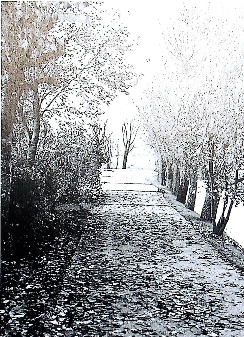
It âlde paad nei de tille; fan Reahûs nei Easterein.